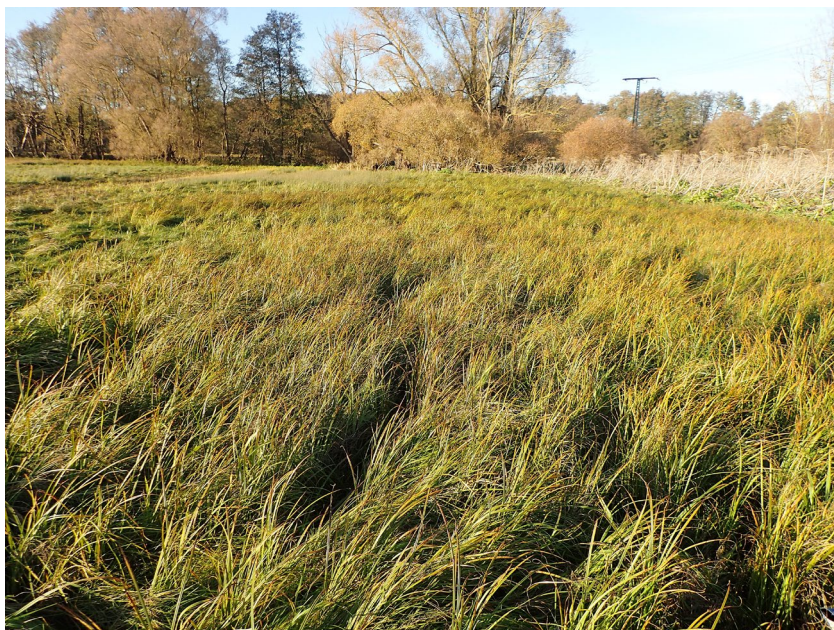
Abb. 3: Aufgelassenes Wirtschaftsgrünland im Recknitztal bei Gruel (Fundort 38).