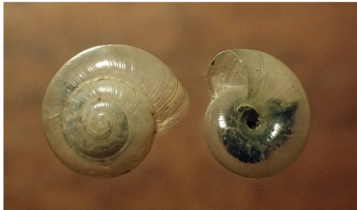
Abb. 7: Perpolita petronella , links vom Fundort 2, rechts vom Fundort 20.

Perpolita petronella (Abb. 7) wurde in MV vor allem in Bruchwäldern, auf Feuchtwiesen, in Seggenrieden sowie am Rand von Quellmooren gefunden, lebt aber auch in linearen Strukturen wie z. B. schmalen Hochstaudensäumen an Fluss- oder Bachufern. Im Untersuchungsgebiet ist sie hauptsächlich in den offenen Nassbiotopen (zehn Fundorte) vertreten, darunter erneut einige degradierte Habitate. Nur eine Beobachtung erfolgte in einem bewaldeten Biotop (Fundort 9: Quell-Erlenbruch im Maibachtal).