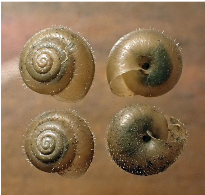
Abb. 8: Pseudotrichia rubiginosa vom Fundort 2.

Auch Pseudotrichia rubiginosa (Abb. 8) ist mit neun Fundorten im GGB nicht selten. Sie wurde ausschließlich an diversen offenen Moorstandorten erfasst, die sich z. T. ebenfalls als degradiert erwiesen. Es sei ausdrücklich davor gewarnt, die Gefährdungssituation der drei letztgenannten Arten aufgrund ihres Vorkommens in stark beeinträchtigten Habitaten fehlzuinterpretieren. Zum einen ist das Vorkommen spezialisierter Arten in für sie suboptimalen Biotopen erfahrungsgemäß ein Indiz für ihre generelle Häufigkeit in einem bestimmten Gebiet. Andererseits sind viele Arten, darunter auch sehr anspruchsvolle, in der Lage, selbst unter stark verschlechterten Lebensbedingungen jahrelang zu überdauern, bevor ihre Populationen erlöschen (Verzögerungseffekt, vgl. FALKNER 1990, MENZEL-HARLOFF 2021b).