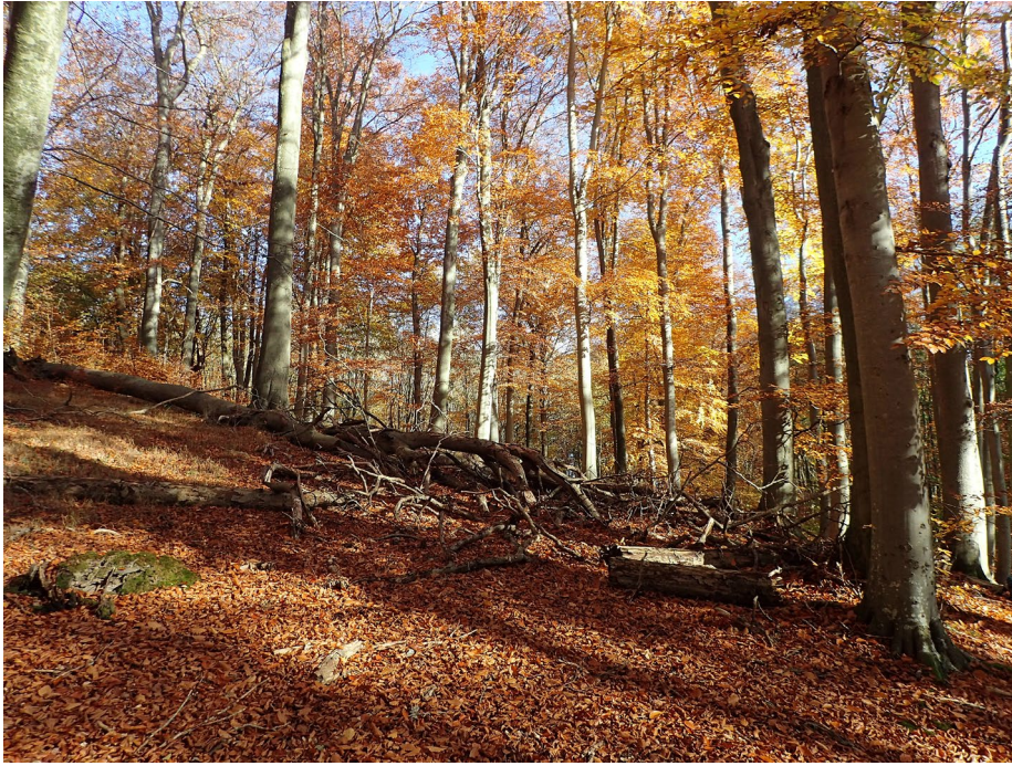
Abb. 4: Tribohmer Bachtal bei Gruel, Buchenhangwald (Fundort 35).