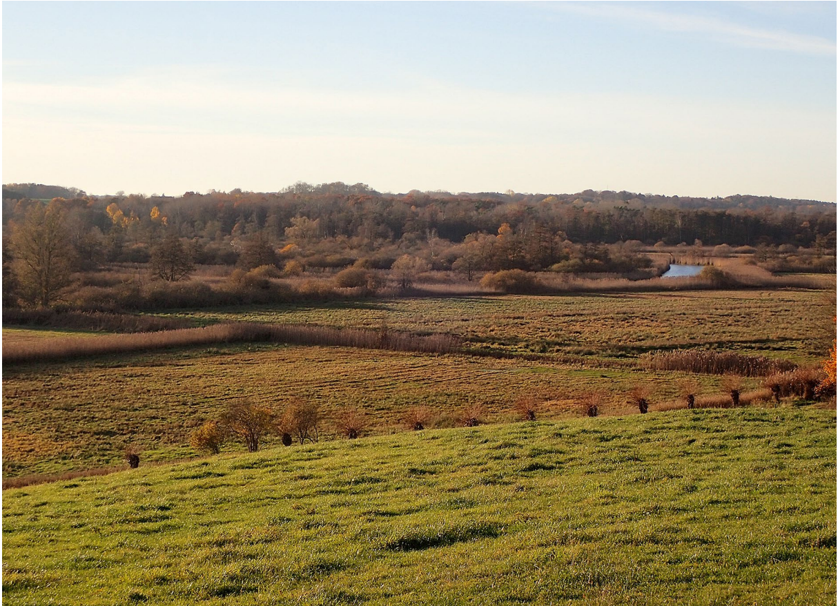
Abb. 2: Recknitztal bei Pantlitz.

der Flusstäler dominieren auf den reicheren Standorten Erlen-Eschenwälder, während die ärmeren Bereiche mit Birken-Moorwäldern bestockt sind. Auf den überwiegend reichen Mineralbodenstandorten der Talhänge wachsen Buchen, Eichen, Edellaubhölzer sowie Kiefern und Fichten (Abb. 4). In den Bachtälern einiger Recknitzzuflüsse (Maibach, Reppeliner Bach, Stegendielsbach, Tribohmer Bach) haben sich auf dauerfeuchtem bzw. quelligem Untergrund zum Teil recht naturnahe Erlen- und Erlen-Eschenwälder erhalten (Abb. 5).