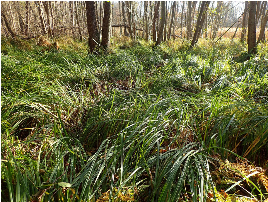
Abb. 5: Tribohmer Bachtal bei Gruel, Quell-Erlenbruch (Fundort 37).

Bisher konnten im GGB 16 Anhang-I-Lebensraumtypen sowie 15 Anhang-II-Tierarten der FFH-Richtlinie erfasst werden, darunter die beiden Windschneckenarten Vertigo angustior und V. moulinsiana . Als einzige Anhang-II-Pflanzenart wurde im Gebiet Liparis loeselii (Sumpf-Glanzkraut) nachgewiesen. Die Erfassung der Molluskenfauna erfolgte an 38 Stationen, wobei auch einige wenige unmittelbar außerhalb des GGB befindliche Standorte berücksichtigt wurden, und beschränkte sich weitgehend auf die Erfassung der Landschnecken. Wassermollusken wurden akzessorisch registriert, wenn sie in Nassbiotopen oder an Gewässerufeln mit Landschnecken unmittelbar vergesellschaftet auftraten. Neben den üblichen Handaufsammlungsmethoden wurden an den meisten Fundorten Substratproben (5-10 Liter) entnommen und zu Hause nach Trocknung und fraktionierter Siebung unter dem Binokular durchgesehen.