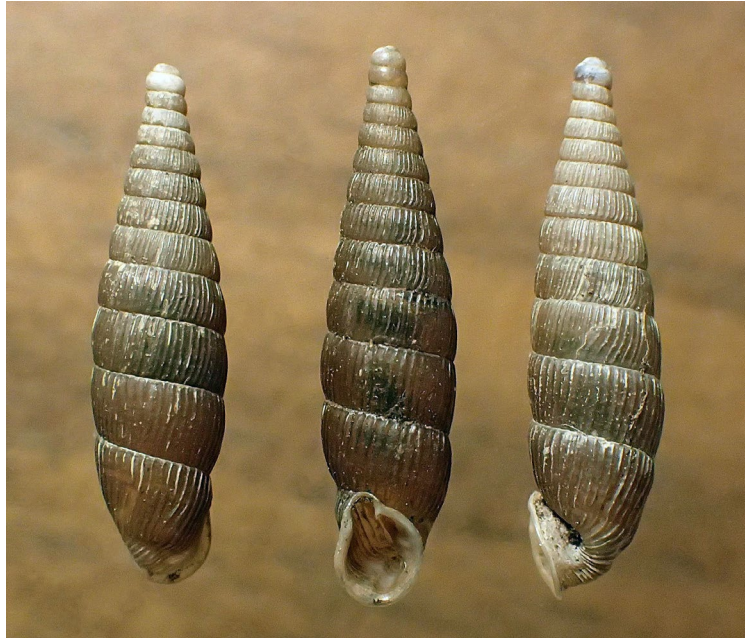
Abb. 9: Clausilia pumila vom Fundort 7.

Abschließend sei auf die reichen Vorkommen der an jeweils elf Fundorten nachgewiesenen Clausilia pumila (Abb. 9) und Perforatella bidentata hingewiesen, die als wichtige Bestandteile der untersuchten Molluskengemeinschaften neben den bereits genannten Arten maßgeblich zur malakofaunistischen Charakterisierung des Untersuchungsgebietes beitragen.