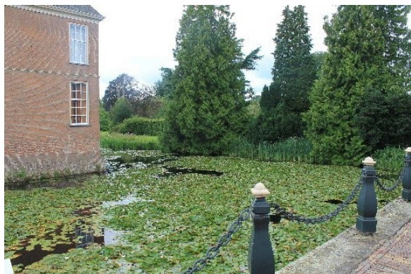
Schloss Slangenburg