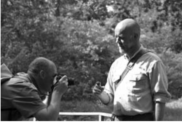
Abb. 2: Arion rufus , Fotodokumentation