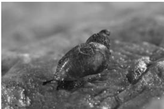
Abb. 1: Quickella arenaria auf Öland

Ölands Molluskenfauna beinhaltet mehrere in Mitteleuropa sehr ungewöhnliche oder nur noch relikitär vorkommende Arten, deren Lebensraum und Lebensgewohnheiten die Tagungsteilnehmer erleben oder kennen lernen konnten, wie Helicopsis striata auf den Kalktrockenrasen, Quickella arenaria in feuchten oder wechselfeuchten Gebieten auf Kalk oder Zoogenetes harpa als boreo-alpines Faunenelement.