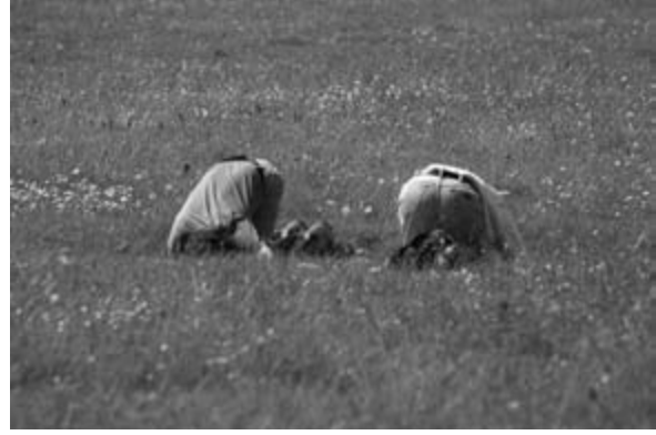
Abb. 3: Truncatellina costulata , Erfassungsmethode